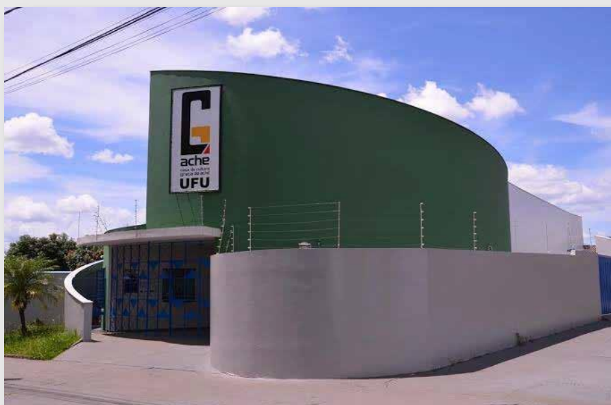
Fachada Graça do Aché