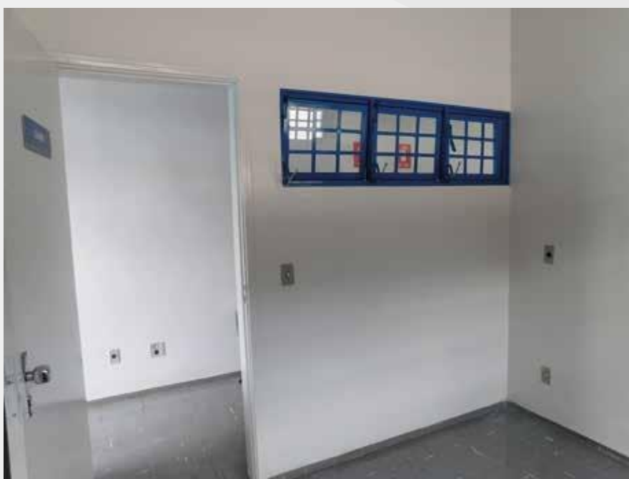
Camarim Foto: Felipe Sant'Anna (2020)

Área de Camarim > Espaço de Camarim 7,15 m 2 + Banho 3,10 m 2 = 10,25 m 2