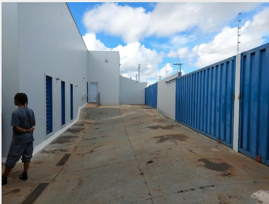
Área externa Graça do Aché

Área externa cimentada > aproximadamente > 166,56 m 2