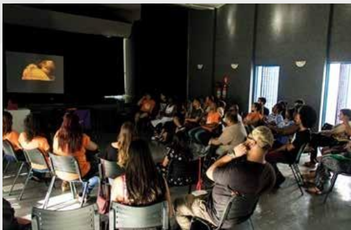
Visão parcial do auditório do Graça do Aché