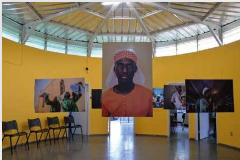
Visão parcial da galeria do Graça do Aché